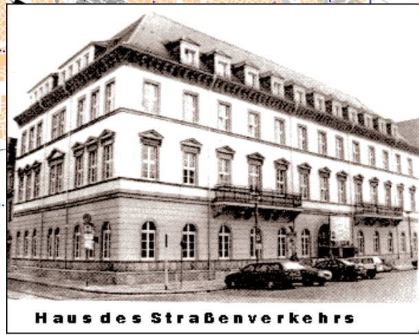
Haus des Straßenverkehrs